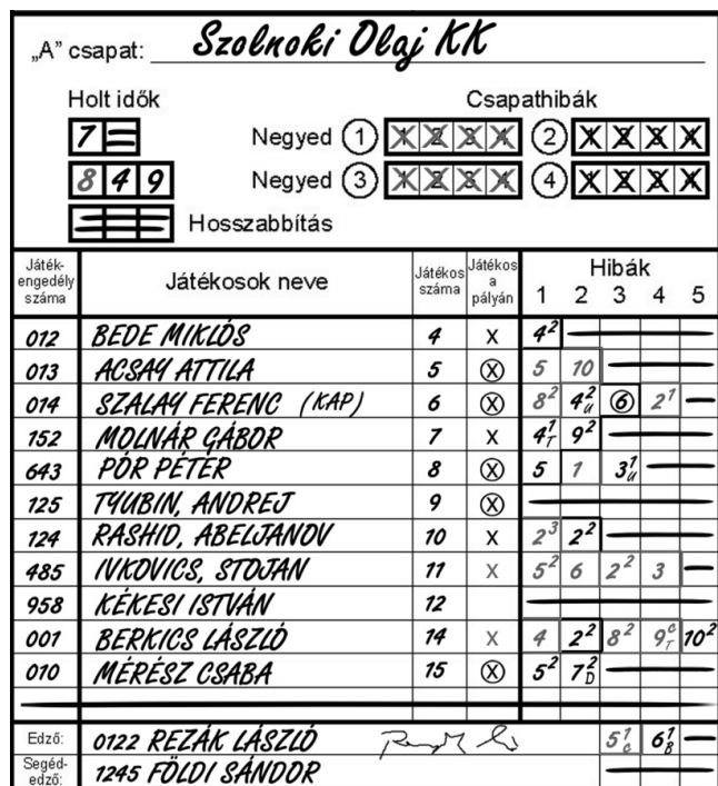
10. ábra A csapatok a jegyzőkönyvben

Elsőként az „A” csapat edzője köteles megadni a fenti információkat.